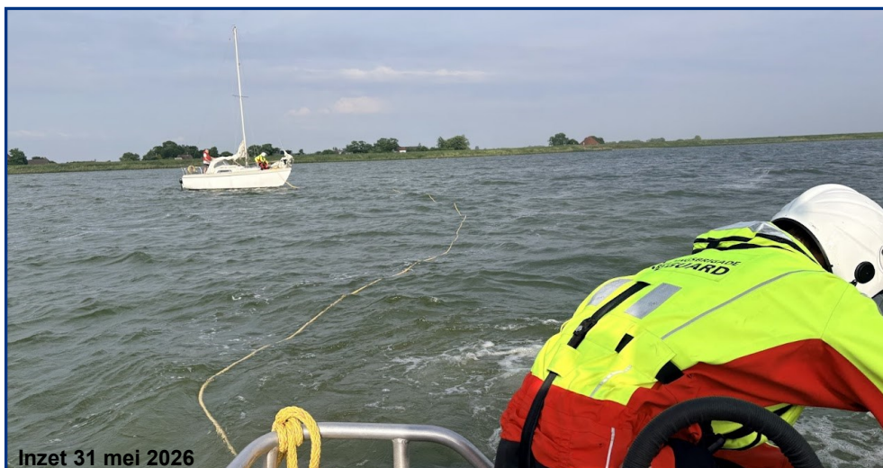
Inzet 31 mei 2026

Voor de Hayo opstappers was het toen helaas al wel te laat om nog naar het conditie-zwemmen te gaan op de zondagavond.